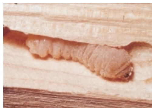
Huisboktor - larve