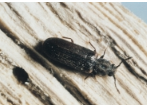
Spinhoutkever - volwassen insect

In hout komen verscheidene insectensoorten voor. Maar niet iedere soort die we aantreffen, vraagt om (dezelfde) tegenmaatregelen. Rekening houdend met de maatregelen, kunnen we houtaantastende insecten als volgt indelen: 1