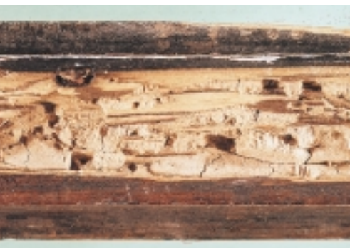
Huisboktor - aantasting is vaak ernstig, maar beperkt zich tot het spinthout