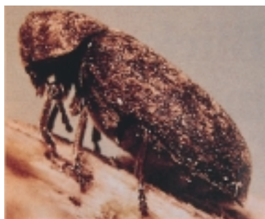
Bonte knaagkever - volwassen insect. Kenmerkend is het gevlekte uiterlijk

Gewone houtwormkever Aantastingen – ook de langdurige – zijn zelden ernstig en hebben zelden gevolgen voor de constructieve samenhang. Alleen bij aanhoudende vochtproblemen ontstaan soms ernstige aantastingen. Dan kan ook verzwakking ontstaan in zeer licht uitgevoerde delen – slanke balklagen en vloerdelen – als daaraan veel spinhout zit. In kappen en begane grondvloeren met een goede ventilatie is het houtvochtgehalte meestal niet hoog, waardoor aantastingen traag verlopen en zelden ernstig zijn. Aantastingen stoppen vaak vanzelf in zeer droog hout (vochtgehalte van 12% of lager over het gehele jaar). Dit is door (plaatsing van) centrale verwarming goed mogelijk in binnentimmerwerk, verdiepingvloeren en trappen. Verder kent de gewone houtwormkever veel insecten die op hem jagen of parasiteren. Door toedoen van deze belagers kunnen aantastingen vanzelf zijn gestopt.