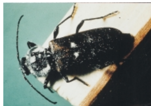
Huisboktor - volwassen insect. Kenmerkend zijn de lange voelsprietten, de twee witte vlekken op de dekschilden en de dikke dijen