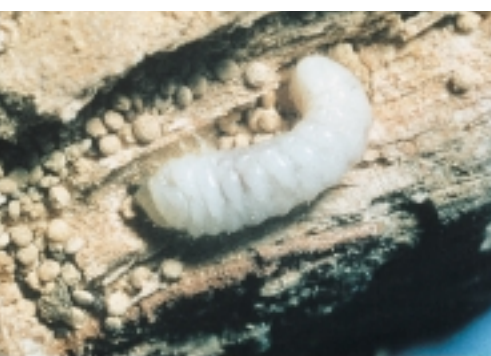
Bonte knaagkever - larve. Daar omheen talrijke lensvormige deeltjes die we ook aantreffen in het boormeel

Bonte knaagkever Soms zijn aantastingen wijdverbreid en beperken ze zich tot het spinhout. Deze aantastingen – meestal in gebouwen met condensatieproblemen – zijn niet zorgwekkend voor de constructieve samenhang. Maar de meeste aantastingen zijn zeer plaatselijk, komen daar al talloze jaren voor en zitten tot diep in het kernhout. Daarbij gaat het vaak om zwaar uitgevoerd hout dat (gedeeltelijk) schuil gaat in vochtige muren (muurstijlen van korbeelstellen, muurplaten en balkkoppen). Deze aantastingen kunnen na verloop van tijd zeer ernstig zijn. Aantastingen in droger hout (vochtgehalte van 15% of lager door het gehele jaar) zijn ook mogelijk, maar deze verlopen trager en de schade is navenant geringer. Aantastingen buiten het spinhout moeten we zorgvuldig beoordelen op ernst en constructieve samenhang. Zeker in zware constructies. Want in hun kern kunnen – door toedoen van schimmels én bonte knaagkever – holle ruimten zijn ontstaan. Om deze verborgen schade vast te stellen, moeten we in het hout boren met een speciale dunne naald (zie kader op pagina 9).