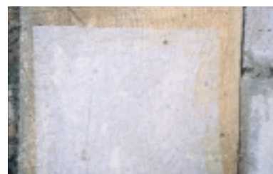
Papier geplakt over een aantal uitvliegopeningen om zo de activiteit te bepalen. In het papier onder zit een gaatje en dus is de aantasting actief. Boven gaat het om een oude, niet-actieve aantasting